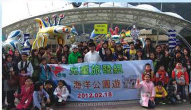
家長和小朋友們都擺出勝利的手勢

有見及此，兒童旅發組與多個志願機構、主題公園和旅遊機構商討後，由各旅遊機構贊助或捐贈資源，配合志願團體、非政府社區服務組織調撥人手，定期安排免費旅遊活動。於2月18日，觀塘秀茂坪社區服務中心獲“兒童旅發組”之邀請，舉辦海洋公園一日遊活動，為區內低收入家庭提供免費遊覽海洋公園的機會，帶領六十名參加者認識香港的旅遊景點。是次活動反應