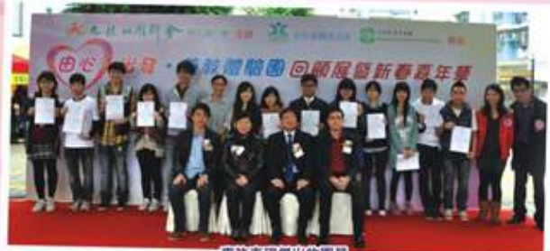
嘉許表現傑出的團員