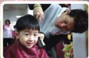
連小朋友也坐下來享受剪髮之樂