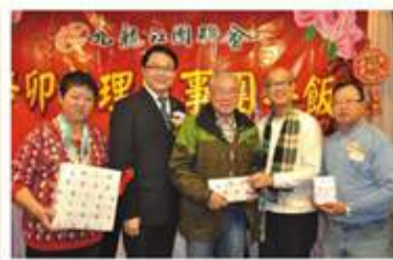
出席者獲獎，滿載而歸