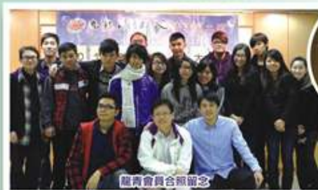
龍青會員合照留念