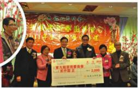
東九龍居民委員會奪得「2011年度會員發展運動」一等獎