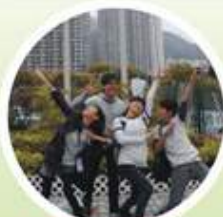
參賽者在黃大仙廣場前大聲唱出「獅子山下」，加上有趣動作取得創意分！

經過去年的比賽，今年的定向比賽參加情況更為激烈，活動於1月8日上午舉行，共有29隊參賽隊伍，多達110人，以保良局何壽南小學為起點。去年的參賽者今年繼續參賽爭奪殊榮外，邀請不少朋友出席參加，身體力行把綠色訊息宣揚給身邊人。是次比賽更特意加入一些鮮為人知的地方作檢查點，例如竹園鄉內毫不起眼的磁布石、樂富更名前的「老虎岩變電站」等，參加者可謂環繞黃大仙跑了一圈。雖然眼見每一位參賽者回到起點時均氣喘如牛，但相信他們在這次旅程中，不僅增進了彼此的友誼，而且發掘了黃大仙區的與別不同。