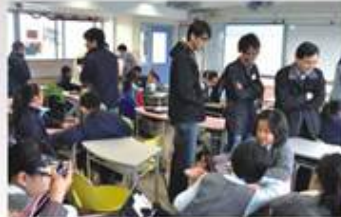
委員會代表親身視察學生上課情況，加深對電子學習的了解

電子學習是一般新趨勢，但並不代表將完全取代傳統教學，傳統教學仍有其存在價值，而且無法代替老師的位置，只要將電子教學適當地運用在輔助及延伸傳統教學之上，定能為教育增添更大的幫助，改善學生的學習質素。電子學習系統的重點應放在「教學」之上，而非只著重「科技」，利用科技與教材內容的配合，讓學生掌握社會的脈動，透過擴展寬廣的視野，提升個人競爭力。