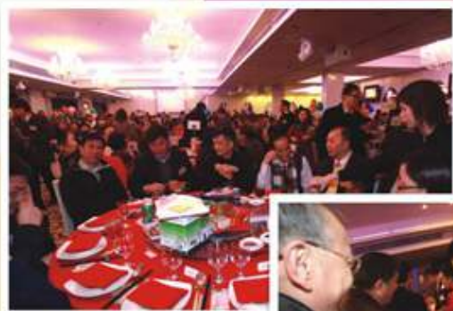
來自不同界別的嘉賓難得聚首一堂