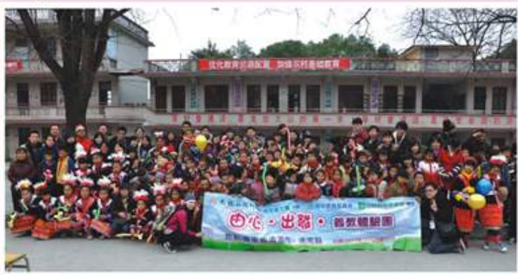
聯歡會後，與內地小學全體師生合照留念