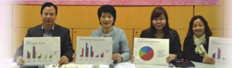
電子學習的應用評估及推行意見調查新聞發佈會