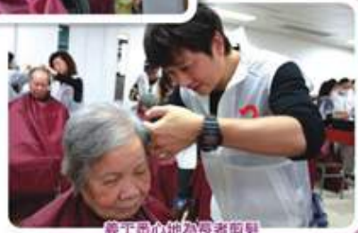
義工悉心為長者剪髮