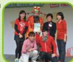
表演團體配合農曆新年精心打扮

當日更特別表揚在社區綠戰隊中，三年內持續不斷地支持本會活動，並且在今年服務時數達30小時或以上的二十位傑出義工，委任成為「先鋒綠戰隊」，藉此鼓勵大家更積極投入環保工作。本會黃大仙地區委員會已是第五年成功獲黃大仙區議會撥款舉辦社區環保推廣的工作，希望來年繼續獲得各界支持，共同為減碳生活努力。