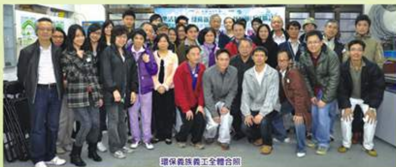
環保義族義工全體合照