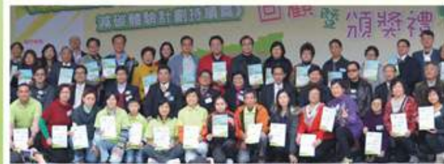
主禮嘉賓與協辦團體和「先鋒綠戰隊」合照