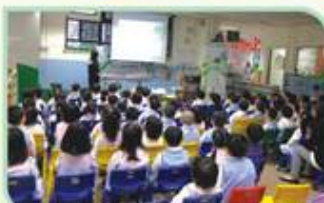
環保團體導師到校為學生教授減碳節能知識

為加強社區推廣環保訊息，本會榮幸獲得環境及自然保育基金撥款贊助，於2011年11月至2012年12月期間，在觀塘、九龍城及油尖旺區推行名為「樂活九龍·綠適新世代—社區節能推廣計劃」，計劃獲香港科技大學擔任顧問機構，樂耕園及九龍地域校長聯會擔任合辦機構，大埔環保會擔任協辦機構，環境保護署、民政事務總署、康樂及文化事務署、水務署、義務工作發展局、職業訓練局、嘉道理農場暨植物園、香港電器及電子設備回收協會及香港電熱器具專業人員協會擔任協助機構。