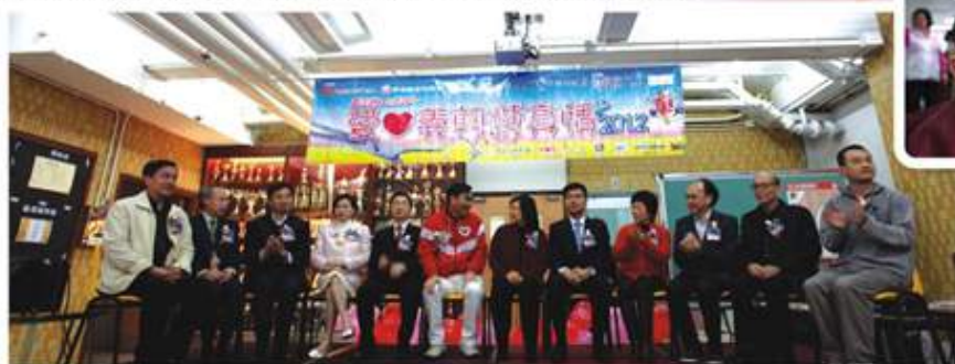
一眾嘉賓對活動表示贊賞

常言道「施比受更為有福」，相信每一位參與過義務工作的朋友都會感受到；而「人間有愛」更是貼切形容充滿愛心的深水埗，讓我們將這份精神承傳下去。