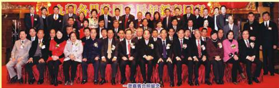
一眾嘉賓合照留念