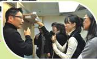
香港電熱器具專業人員協會導師向義工講解為住戶更換節能產品時的注意事項