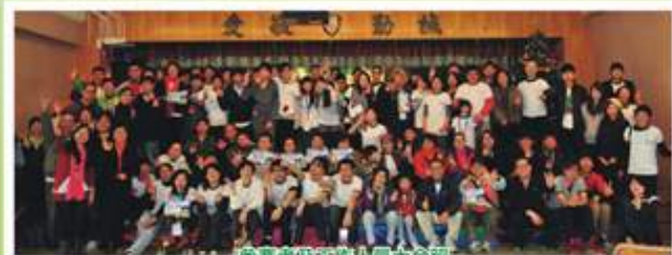
參賽者及工作人員大合照

經過去年的比賽，今年的定向比賽參加情況更為激烈，活動於1月8日上午舉行，共有29隊參賽隊伍，多達110人，以保良局何壽南小學為起點。去年的參賽者今年繼續參賽爭奪殊榮外，邀請不少朋友出席參加，身體力行把綠色訊息宣揚給身邊人。是次比賽更特意加入一些鮮為人知的地方作檢查點，例如竹園鄉內毫不起眼的磁布石、樂富更名前的「老虎岩變電站」等，參加者可謂環繞黃大仙跑了一圈。雖然眼見每一位參賽者回到起點時均氣喘如牛，但相信他們在這次旅程中，不僅增進了彼此的友誼，而且發掘了黃大仙區的與別不同。