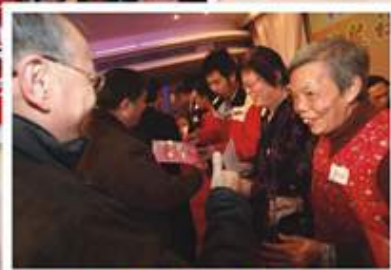
領贈義工嘉許獎狀的珍貴時刻

為慶祝本會觀塘地區委員會成立五週年，1月4日晚上聯同六十多個觀塘區各界團體，假座九龍灣國際展貿中心13樓煌府大酒樓海景廳，舉辦了『九龍社團聯會觀塘地區委員會五週年會慶暨觀塘區義工團年聯歡晚宴』，筵開五十席，感謝地區義工多年來為社區付出的辛勞，加深區內各團體的友好關係，增進義工之間的友誼和交流。活動得到多個團體及熱心人士贊助，觀塘區600名義工踴躍參加盡興而回，活動亦得以順利圓滿舉行。