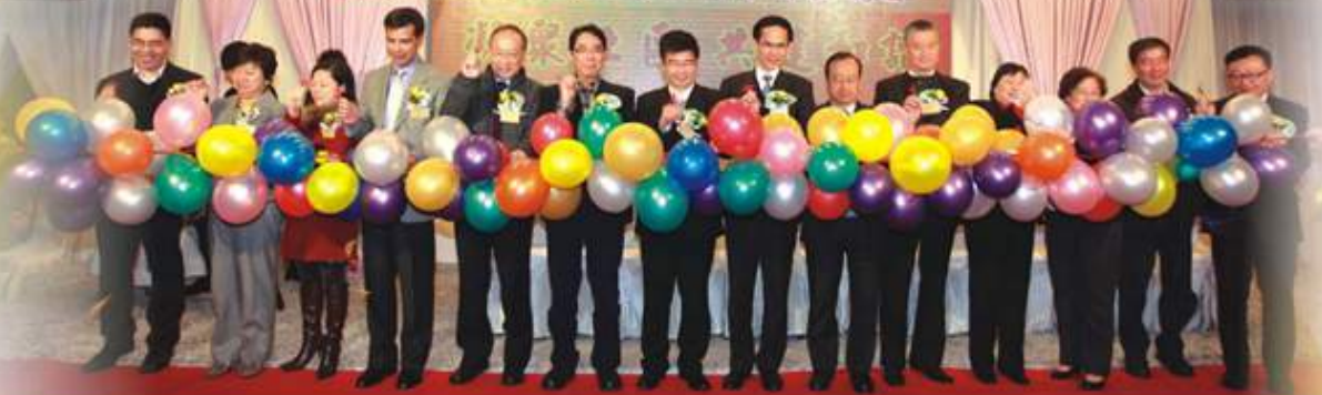
一個簡單而隆重的儀式為晚宴揭開序幕

為慶祝本會觀塘地區委員會成立五週年，1月4日晚上聯同六十多個觀塘區各界團體，假座九龍灣國際展貿中心13樓煌府大酒樓海景廳，舉辦了『九龍社團聯會觀塘地區委員會五週年會慶暨觀塘區義工團年聯歡晚宴』，筵開五十席，感謝地區義工多年來為社區付出的辛勞，加深區內各團體的友好關係，增進義工之間的友誼和交流。活動得到多個團體及熱心人士贊助，觀塘區600名義工踴躍參加盡興而回，活動亦得以順利圓滿舉行。