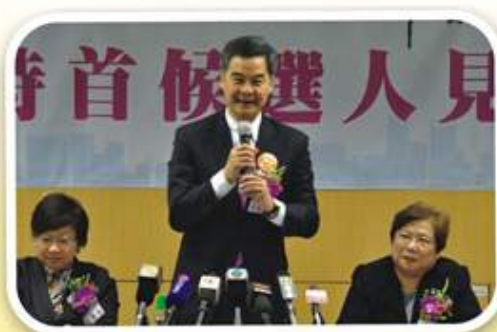
候選人梁振英先生闡述參選政綱

第四屆行政長官選舉於2012年3月25日舉行，本會一直關心社會事務，對於新一屆特首及政府的施政非常關注，故於2月13日假本會會址舉辦「與特首候選人見面會」，以了解候選人的參選理念及治港藍圖，逾百多名參加者、十多間傳媒機構代表到場參與，座無虛席，反應熱烈。