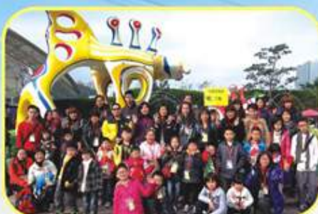
大家在海洋公園前來個大合照

2011年8月上旬，報章刊登了一項低收入家庭兒童調查報告，受訪家庭中，有過半數兒童表示從未到訪香港迪士尼樂園及太空館；此外，更有高達62%和58%表示未曾踏足免費入場的香港公園和山頂。