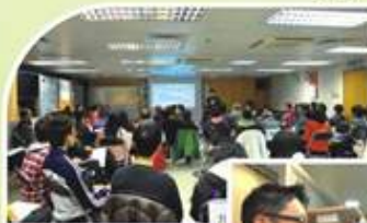
邀請義務工作發展局及大埔環保會導師為義工講解上門探訪技巧及環保知識