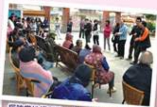
探訪當地福利院，為長者表演唱歌