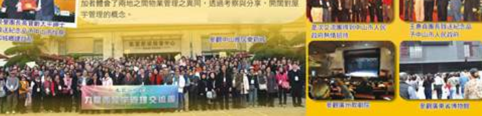
九龍西屋宇管理交流團

是次活動行程緊湊，抵達中山後，參觀了著名的孫文公園，及中山雅居樂新城，並在中港英文學校進行屋宇管理交流團研討會，各代表分享法團管理的寶貴經驗，晚宴中中山市人民政府熱情款待。第二天，團員參觀了廣州火車站、廣州歌劇院、廣東省博物館及參觀世界第一高的新電視塔「海心塔」。短短的兩天交流，參加者體會了兩地之間物業管理之異同，透過觀察與分享，開闊了屋宇管理的觀念。