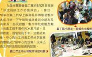
義工與小朋友一起製作中秋燈籠。

六福社區服務會義工於8月21日舉辦「冰皮月餅工作坊探訪」，當日，19名義工於早上由區議員帶領製作冰皮月餅，下午則到區議會與小朋友及其家長一起作遊戲，製作中秋燈籠及獻上由義工親手製作的冰皮月餅，共歡慶一個愉快的下午。活動結束後，中心的社工與義工們分享服務的經驗及介紹中心的設施，以深化義工們對這類型服務的認識。