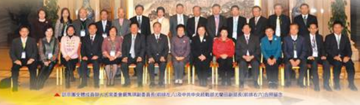
訪京團全體成員與全國政協副委員長(前排左八)及中共中央統戰部副部長(前排右六)合影留念