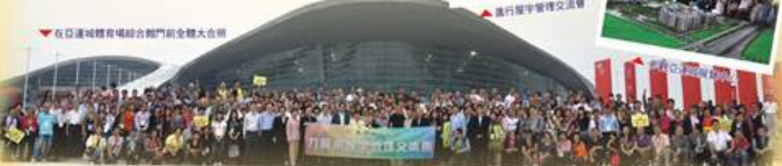
在亞洲體育場綜合館門前全體合照

抵達香港後，參觀第16屆亞洲城市體育場綜合館、星河灣屋苑、廣州南站、廣東省博物館(新館)及遊覽廣州大學城嶺南印象等活動。在這兩天行程中，參與者體驗了廣州城市的變革，如何提升當地居民的居住環境，以及感受到廣州城市的活力和競爭力。