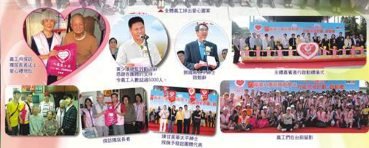
全體義工排成愛心圖案