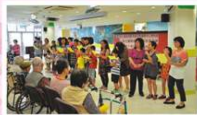
參與探訪的家庭為護老院長者唱出一首〈朋友〉歌曲，憑歌寄意