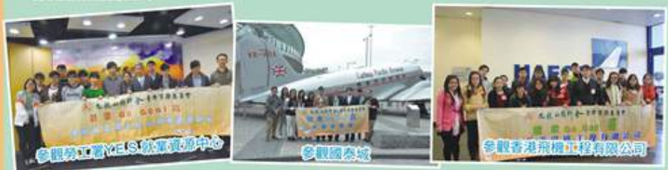
參觀勞工署YES就業資源中心

為協助青年人認識自我及了解職業志向，掌握最新就業環境的資訊，提升就業競爭力。九龍社團聯會青年事務員會推出「就業GO GOAL高」系列計劃，定期舉辦就業講座、職業技能培訓工作坊等，為青年人提供最新的就業資訊。