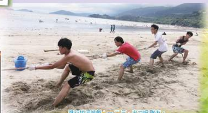
進行拔河遊戲：一二三，出力呀隊友。