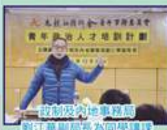
政制及內地事務局 劉江華副局長為同學講課

為培訓青年人才，青委會舉辦「青年政治人才培訓計劃」，邀請不同範疇的官員及學者為青年講課，目的提升青年人對國家的認知，及對社會的責任感，透過課堂的理論，提升他們對公共政策的認識，及拓展其領導才能和議政能力。