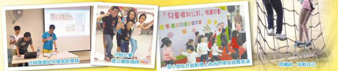
分組匯報如何撰寫新聞稿

為提升兒童及社會大眾認識公約內容，青年義工團得到政制及內地事務局資助，推行「童心童樂・「兒童權利公約」推廣計劃」。透過一系列活動，包括：童眼看世界「兒童權利公約」小记者一培訓工作坊、「兒童權利公約大使」培訓營及分享會暨嘉年華會等，向18歲以下兒童、社會大眾推廣公約。