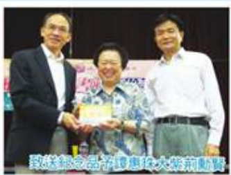
致送紀念品予譚惠珠大藥劑勳賢