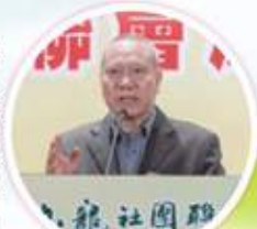
劉道強先生演講「解讀白皮書」

儀式完結後，邀請到基本法委員會委員劉道強先生進行主題演講「解讀白皮書」，在場人士留心聽講，加深了解白皮書內容。晚宴期間，邀請到不同團體作表演，其中由著名魔術師Louis Yan帶來了三項魔術表演，更邀請不同嘉賓參與，另外當晚亦同時進行抽獎，在場嘉賓相當投入，氣氛熱烈，是次晚會在一片掌聲中圓滿結束。