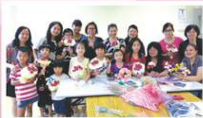
學員們經過一番努力下完成了一束束美麗的玫瑰花