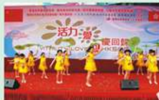
9月21日賀國慶活動表演

2014年7月1日，九龍社團聯合會觀塘地區委員會於觀塘各區，包括秀茂坪、翠屏邨、牛頭角上邨、順安邨、啟業邨及彩盈邨，舉行「活力愛、慶回歸」活動。當日活動邀請不少社會賢達及知名人士出席及主禮活動。台上各式各樣的精彩表演，台下形形色式的攤位遊戲，吸引街坊觀賞及參與，為各區的嘉年華會生色不少。加上當日大會安排慶回歸花車穿梭觀塘各區，遊走大街小巷，與觀塘民眾齊慶回歸，與眾同樂。