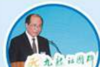
教育廳廳長吳克儉先生 出席啟動禮並致辭勉勵同學 大學生到廣東省不同地區實習，擔任不同工作，親身體會內地的 經濟文化和社會發展。

因應內地經濟急速發展，不少香港企業先後往內地發展，大學畢業生往內地發展事業更成為大趨勢。自2010年，九龍社團聯會已舉辦大學生內地實習計劃，讓大學生吸取更多工作經驗，認識內地工作環境，學習內地企業文化。2014年度，本會得到青年事務委員會的贊助，舉辦「青年躍動大學生實習領航計劃2014」，暑假期間安排100名