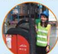
招商局物流集團有限公司的實習生參觀招商局物流倉庫

因應內地經濟急速發展，不少香港企業先後往內地發展，大學畢業生往內地發展事業更成為大趨勢。自2010年，九龍社團聯會已舉辦大學生內地實習計劃，讓大學生吸取更多工作經驗，認識內地工作環境，學習內地企業文化。2014年度，本會得到青年事務委員會的贊助，舉辦「青年躍動大學生實習領航計劃2014」，暑假期間安排100名