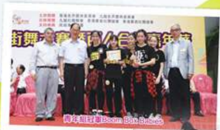
青年組冠軍 Boom Box Babies

公開組冠軍則由Strangers奪得，隊員之間合作無間，動作快速又帥氣，全場觀眾都隨之躍動，吸引不少途人駐足欣賞。