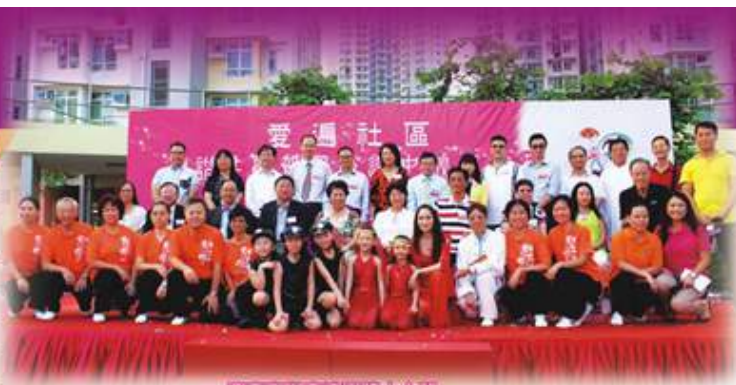
「愛遍社區和諧共融慶祝國慶迎中秋嘉年華」