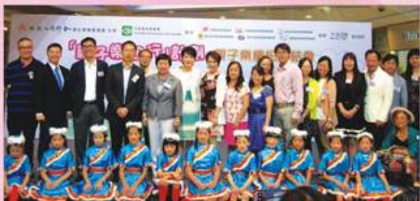
蒞臨總結會的一眾嘉賓與參與計劃表演的小朋友大合照