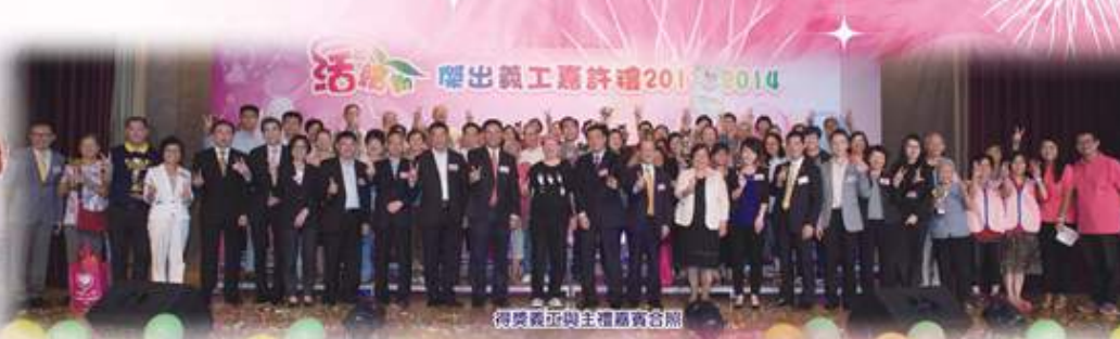
得獎義工與主禮嘉賓合照