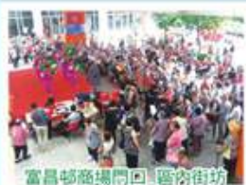
富昌邨商場門口 區內街坊一同欣賞歌舞表演

由九龍社團聯合會深水埗地區委員會、深水埗居民聯會等82個深水埗地區團體合辦，於2014年7月1日分別在深水埗區內舉辦了5場慶祝香港回歸祖國17周年嘉年華，包括：長沙灣保安道球場、石硤尾邨23座籃球場、富昌邨商場門口、麗安邨噴水池則及美孚葵涌道天橋底，透過嘉年華的形式，與深水埗區內的街坊共同慶祝香港回歸祖國十七周年。