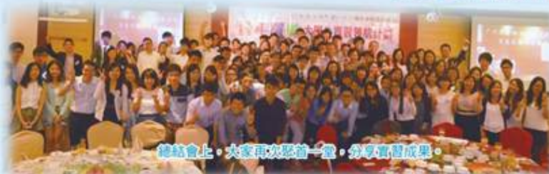
總結會上，大家再次聚首一堂，分享實習成果。

實習計劃於8月29日假九龍維景酒店舉行總結會，各實習機構代表、院校代表、實習畢業生聚首一堂，分享實習成果。同時嘉許於實習計劃期間表現出色的實習同學。