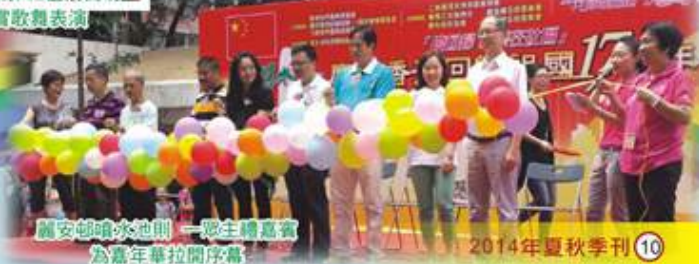
麗安邨噴水池則 一眾主禮嘉賓為嘉年華拉開序幕