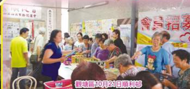
觀塘區10月21日順利邨