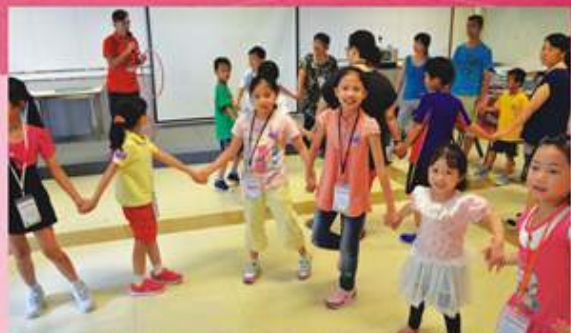
日營期間，義務工作發展局的導師帶領學員玩團隊遊戲，帶出團結的重要性

是次計劃共有26個家庭參加，總人數達70人。其中共17個家庭參與計劃活動三次或以上，獲得本會頒發之證書。