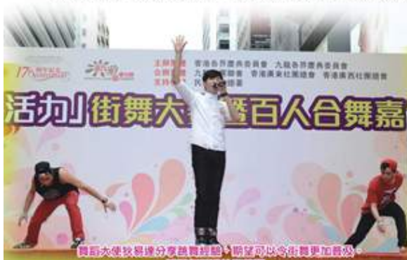
舞蹈大使教舞場分家鼓勵推廣，期望可以令街舞更加普及，透過舞蹈發放正能量。