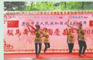
9月21日賀國慶活動表演