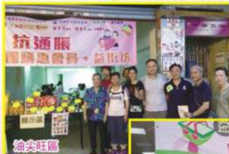
油尖旺區 5月27日砵蘭街