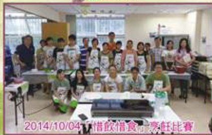
2014/10/04「惜飲惜食」烹飪比賽