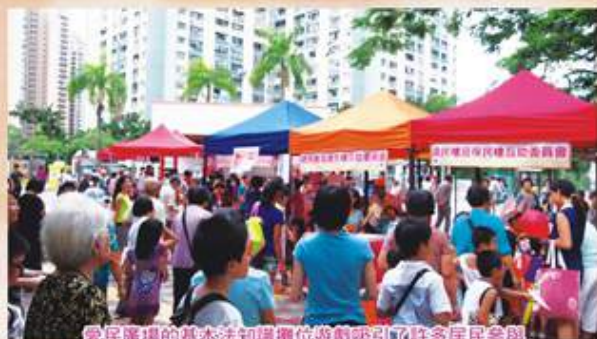
愛民廣場的基本法知識攤位遊戲吸引許多居民參與

最近的在2014年8月9日下午2時於紅磡邨中央公園舉辦的嘉年華活動，現場除了有精彩的歌舞表演外，還有豐富的攤位遊戲。而且還有義工派發各種宣傳《基本法》知識的宣傳品，現場吸引了近500人次參與，活動十分順利。