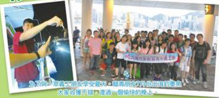
為了與一眾義工朋友享受夏天，龍青朋友7月份出海的墨魚，大家收穫不錯，度過一個愉快的晚上。