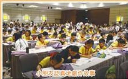
小朋友認真地創作故事

2014年7月，得到亞洲週刊的贊助，聯會協辦了「閱讀，從這一天開始」的活動，青年義工團協助帶領300名小朋友前往書展，一同聽作家分享創作經驗，選購書本及進行寫作，推廣閱讀文化。