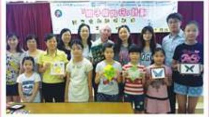
學員們紛紛展示美麗的剪紙作品