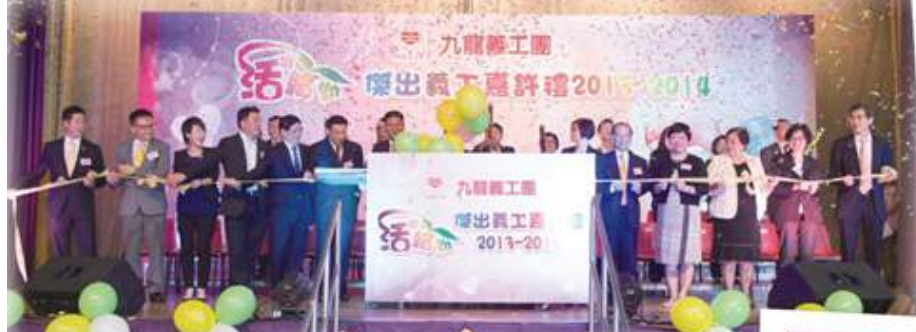
傑出義工嘉許禮啟動儀式