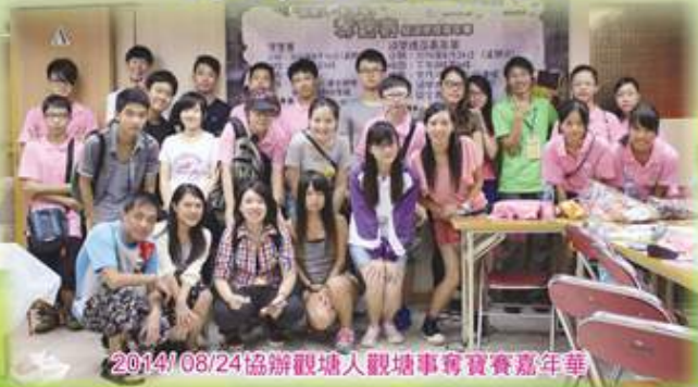
2014/08/24協辦觀塘人觀塘事務賽賽嘉年華