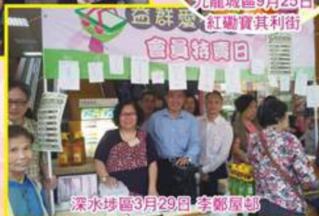
深水埗區3月29日 李鄭屋邨