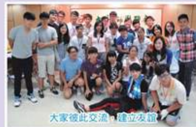
大家彼此交流，建立友誼

來自澳門的青年朋友與我們進行交流，分享兩地青年的生活、升學、義務工作等，增加了解兩地的青年事務發展。