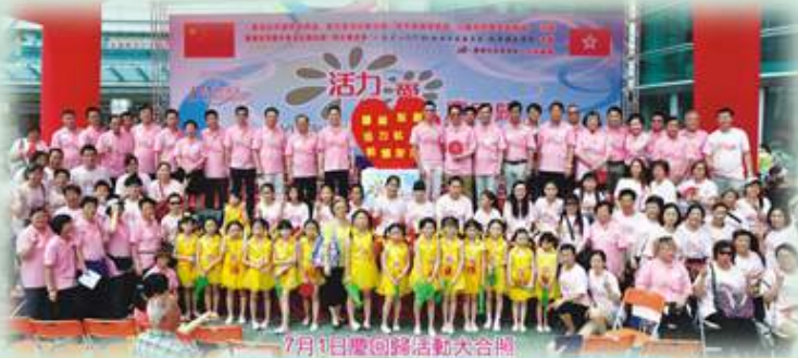
7月1日慶回歸活動大合照

為慶祝中華人民共和國成立65周年華誕，2014年9月21日九龍社團聯合會觀塘地區委員會在觀塘翠屏邨，舉辦「駿馬奔騰賀國慶嘉年華2014」活動。社區義工組成的表演隊，落力表演，節目豐富精彩，包括歌唱表演、街舞表演及魔術表演，更舉行問答環節，吸引街坊觀摩，同賀國慶，共享歡樂。