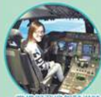
一嘗模擬飛機駕駛滋味