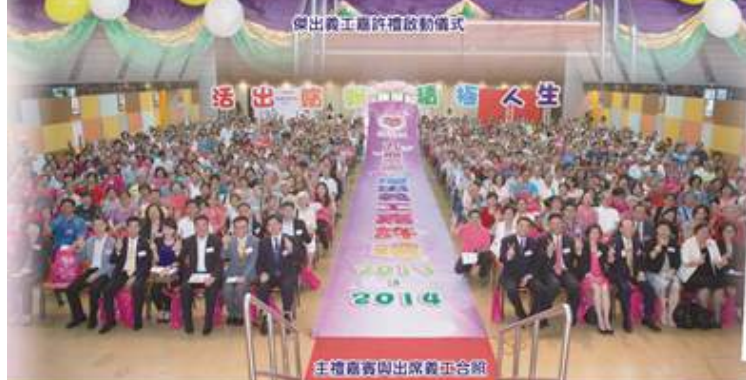
主禮嘉賓與出席義工合照