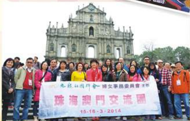
一班委員於澳門名勝大三巴牌坊前合照留影