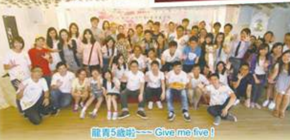
龍青5歲啦——Give me five!