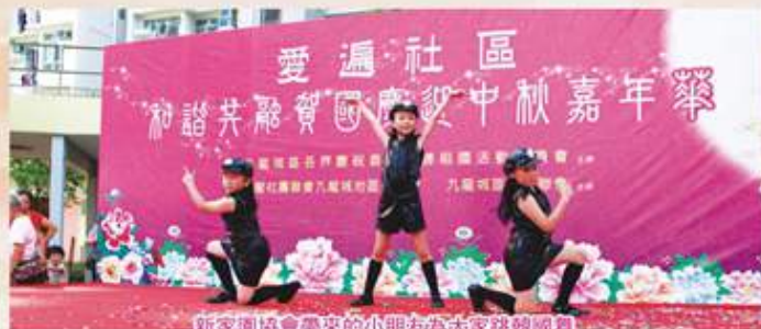
新家園協會帶來的小朋友為大家跳韓國舞

「愛遍社區和諧共融賀國慶迎中秋嘉年華」於2014年9月2日在德朗邨太極場舉行，出席的嘉賓有中聯辦王小靈副部長、九龍城區議會主席劉偉榮、九龍城區慶委會徐莉主席等，還有多個地區團體以及學校團體參與是次活動。活動除了有精彩的嘉年華節目表演外，還有豐富的攤位遊戲，今次因有學校團體各自提供一個嘉年華表演節目，所以現場氣氛十分熱烈，整個活動吸引約1000人參與。