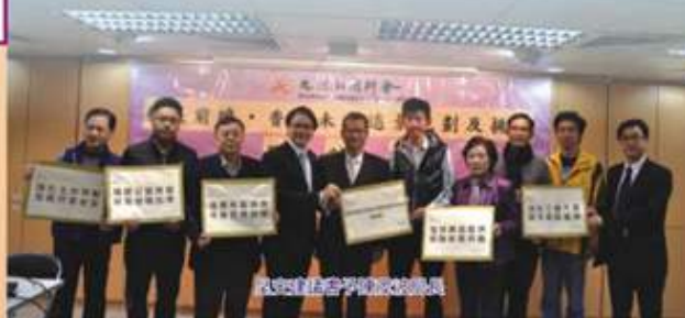
本會社會政策委員會代表