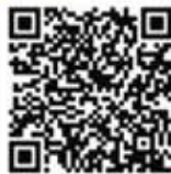
Apps QR Code

隨著現今資訊科技發達，智能手機應用日益普及，比賽透過新穎的方式，用創意設計Apps的概念框架，推廣環保。本會收到46份本地學生參賽作品，當中優勝作品更轉化為Apps，名為「樂活九龍」，於7月份成功上架，公開讓市民免費下載。Apps內容主要以遊戲及資訊提供的方式向市民展示如何從日常生活中節能減碳。