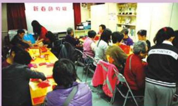
賀新春利是封飾物製作班參加者製作飾物活動情況

九龍城地區委員會在2013年1月30、31日，下午2:30-4:30，舉辦賀新春利是封飾物製作班，有100名參加者報名，深受居民歡迎。