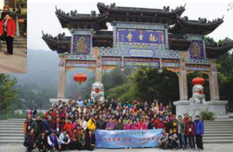
▲文康團體新會江門兩天交流團成員合照

文康團體於2013年1月19及20日舉辦新會、江門兩天遊，是次活動有百多名文康團體成員參加，前往新會小島天堂、觀音寺、十九涌海味市場等多個景點參觀，旅程十分順利，藉此機會加強與各個團體的聯繫。