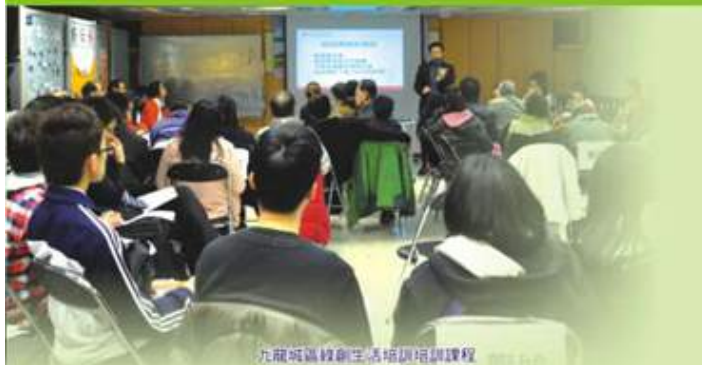
九龍城區綠創生活培訓課程

本會參加九龍社團聯合會主辦的「樂活九龍 - 綠適新世代 - 社區節能推廣計劃」，以加強社區推廣環保訊息。九龍城區義工人數約60人，共探訪家庭服務數目約1400戶。