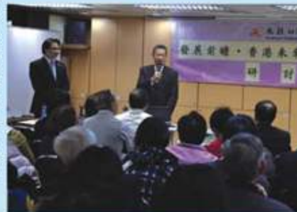
陳茂波局長講述未來香港房屋的發展規劃

鑑於房屋發展是今屆特區政府的施政重點，本會社會政策委員會於1月21日晚上，假會址舉行了「發展前瞻，香港未來遠景規劃及挑戰」研討會，邀請了發展局陳茂波局長作為主講，與八十名團體代表及地區坊眾進行討論。內容包括房屋、土地規劃等等。當日氣氛熱烈，各區踴躍提出意見，本會亦呈交了有關建議書予當局。