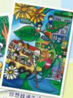
「你想綠適生活」繪畫比賽中學組冠軍作品