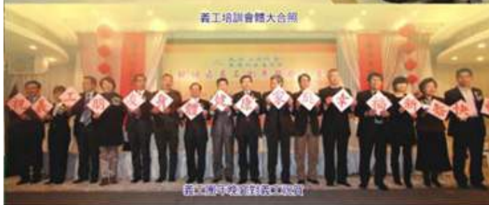
區內各團體獲頒證書