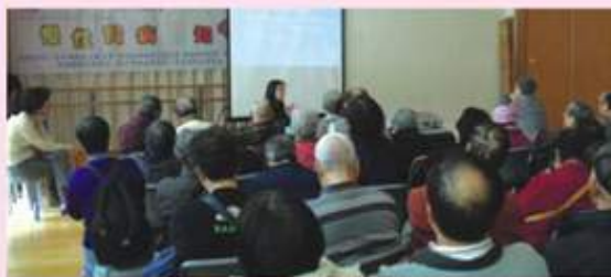
廣華醫院代表向出席者講解預防腎病的知識

油尖旺地區委員會為進一步加強於社區推廣健康資訊，與廣華醫院及油尖旺社團聯合會繼續合作，推出『廣華誠心盡力獻關懷2』系列講座，並分別於2012年10月16日假九龍社團聯合會址舉辦「便秘中西醫知識面面觀」講座及於2013年1月16日假大角咀市政大廈舉辦「慢性腎病知多少」講座，兩場講座共約300名市民參與，參加者認真記錄有關健康資訊並踴躍發問，氣氛熱烈。