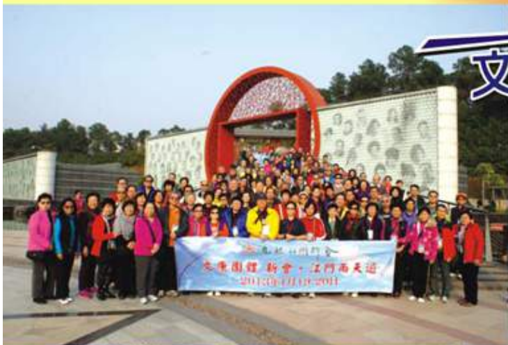
▲文康團體新會江門兩天交流團成員合照

文康團體於2013年1月19及20日舉辦新會、江門兩天遊，是次活動有百多名文康團體成員參加，前往新會小島天堂、觀音寺、十九涌海味市場等多個景點參觀，旅程十分順利，藉此機會加強與各個團體的聯繫。