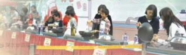
比賽加強家長與參與小朋友的親子關係

除了兩個組別的比賽外，大會特別安排了一場別開生面的嘉賓表演示範，大會為嘉賓準備每人三隻雞蛋，三樣蔥，讓各嘉賓自行發揮創意，烹調一款有營菜式。