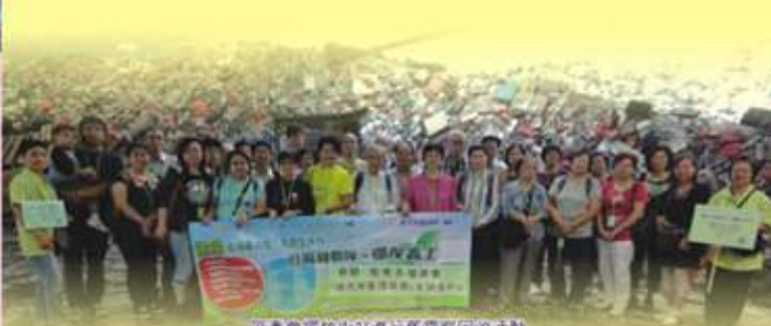
區委會屬放車站進行舊電腦回收活動