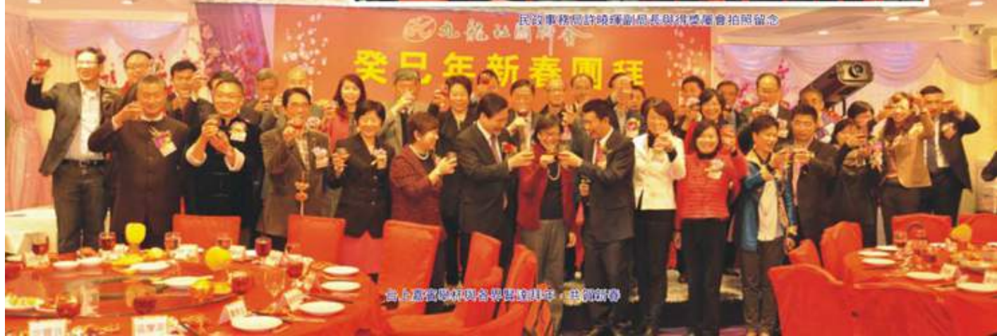
高上嘉賓與各界賢達共賀新春