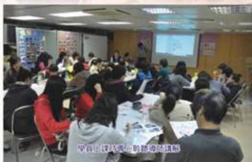
學員上課時聽老師講解導賞

九龍社團聯會成功向市區重建局申請「藝術文化融入舊區」夥伴項目資助計劃，舉辦為期一年的「活化土瓜灣·由牛棚出發」活動。透過導賞員培訓課程、導賞團活動等藝術和文化項目，以牛棚為出發點，讓參加者體驗香港歷史、傳統藝術文化，推動他們參與地區規劃及保育的工作。