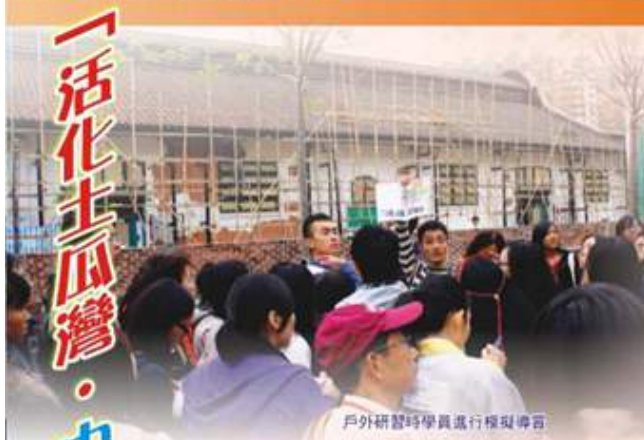
戶外研習時學員進行模擬導賞