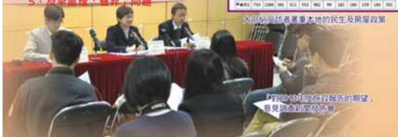
「對2013年度施政報告的期望」意見調查新聞發佈會