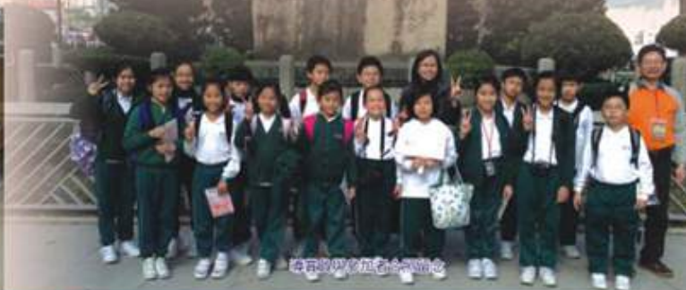
導賞團與參加者合照留念

導賞員培訓課程已於2012年12月完成，從招募中發掘了很多對香港歷史保育及地區文化有興趣的青年及有志人士擔任導賞員，並向全港市民提供導賞團服務。導賞團活動是開放給全港市民參與，並已於2013年2月中旬開展，計劃將舉辦50團(1000人)。受培訓的導賞員將免費為全港市民介紹牛棚藝術村、土瓜灣舊區的周邊的建築、街道的文化及經濟活動形態等，讓市民更瞭解香港舊區的歷史演變，提高他們對當區歷史文化的認識及歸屬感，積極推動市民參與地區規劃及保育。