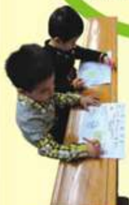
鼓勵學生訂立減碳目標及行動工作紙

11年11月至翌年7月期間，本會邀得環保團體代表親身到26間學校及社福機構，向逾5,000名學生及公眾人士提供環保工作坊，深化不同年齡層的市民對減碳的認知及意識，將環保概念與日常生活模式連結起來，並鼓勵參加者付諸實行低碳生活。