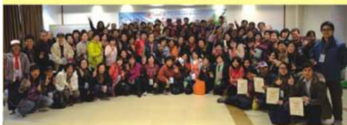
義工培訓會體大合照

1月24日觀塘地區委員會連同區內七十個團體，聯合舉辦「觀塘區義工團年聯歡晚宴」，600多義工歡聚一堂，共同歡度新春佳節。