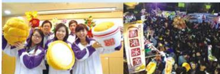
龍青的主力貨品茶餐三寶

說到青年義工團春季的活動，如何不提今年度的年宵盛事呢。今年2月4至9日，龍青在太子花墟一嘗創業滋味。經過眾多青年義工長達半年的籌備，終於創立了屬於龍青的年宵攤位—「香港冰室」。在年宵期間，得到各方群眾鼎力，落力推銷，最後順利將所有貨品售罄，並得到寶貴的營銷經驗。