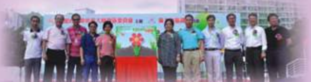
黃大仙地區委員會成員出席《綠色生活黃大仙·再創生命力》啟動禮

活動以嘉年華及競技同樂日形式進行。在活動上，我們介紹了《再創生命力》全年度的活動，並宣佈《綠色生活黃大仙·再創生命力》計劃正式開始。