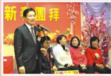
中聯辦林武副主任致賀辭