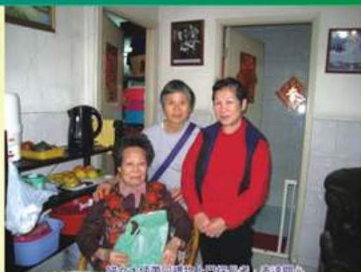
婦女大使帶同禮物探訪長者，表達關懷

活動的初期，首先向本區的婦女及長者宣傳本活動的目的及緊接着舉行的各項相關活動，並且成功招募到30名婦女參與探訪長者活動。並且為參加探訪的義工舉行兩場「義工培訓工作坊」，教導參加探訪的愛深婦女大使在探訪時要注意事項及與長者相處時的技巧。