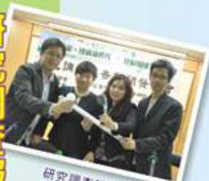
研究調查報告新聞發佈會