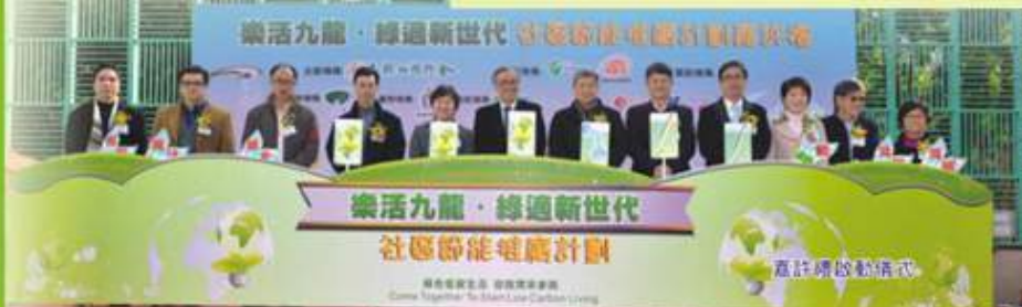
樂活九龍·綠適新世代 社區節能推廣計劃

計劃網頁： www.lohaskin.org.hk 計劃電郵： info@lohaskin.org.hk