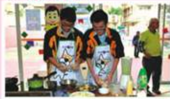
參加者正利用廚餘煮出色香味俱全

我們為宣傳「就地取材」、「不時不食」、「多菜少肉」及「低碳烹調」的環保理念，舉辦「廚餘再生」的烹調比賽。