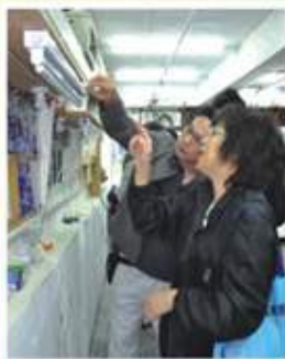
義工學習更換節能產品技巧