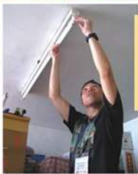
義工上門為家庭更換節能產品

九龍社團聯合會獲 『環境及自然保育基金』 撥款贊助，於2011年11月至 2012年12月期間，於觀塘、九龍 城及油尖旺區推行「樂活九龍· 綠適新世代社區節能推廣計 劃」，旨在加強推廣環保訊 息，提倡綠色生活。