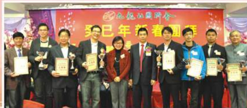
民政事務局許曉暉副局長與得獎屬會拍照留念