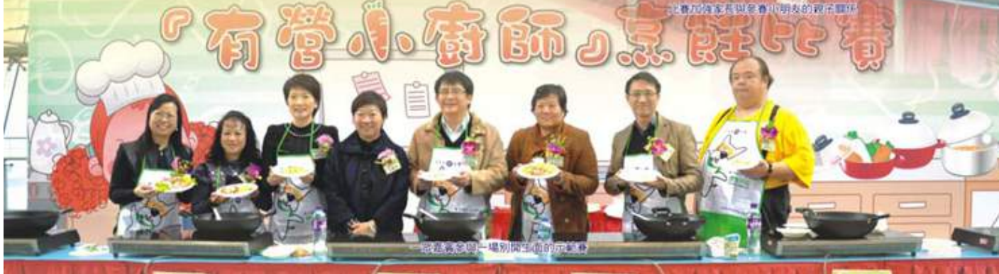
透過烹調一場別開生面的示範會